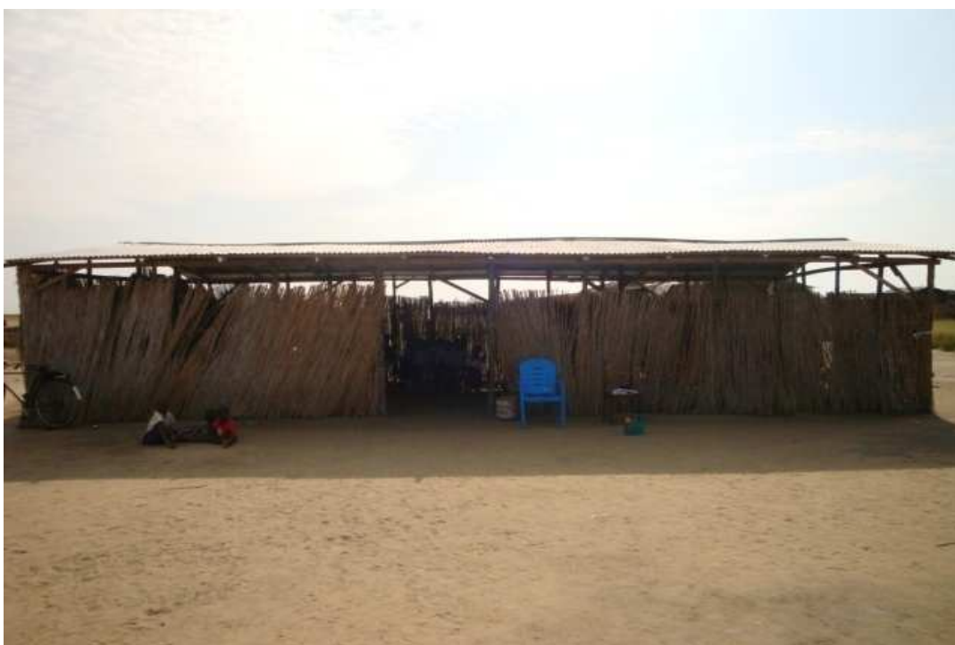
Cliché Sourna Loumtouang Erick, 04 Octobre 2010

L'iconographie comme le mentionne Kaplan est « extrêmement précieuse, puisqu'elle est le seul témoignage réel de l'aspect humain de la vie [...] c'est grâce aux gravures et aux tableaux que nous reconstituons le cadre de vie, l'ambiance d'une époque 48 . La photo ci-dessus présente l'aspect de la Darak International nursery and primary school, école qui après la rétrocession de l'île au Cameroun n'a bénéficié d'une construction en matériaux définitifs. La régularité des pluies dans l'île en saison de crue du lac Tchad et les rafales de vent dévastatrices exposent les élèves à plusieurs risques.